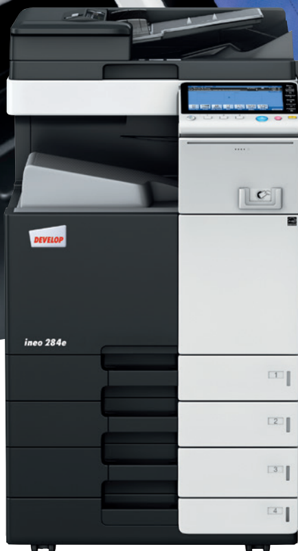
ineo 284e z dwustronnym podajnikiem oryginałów (DF-701) tacą uniwersalną (PC-210) i półką boczną (WT-506)