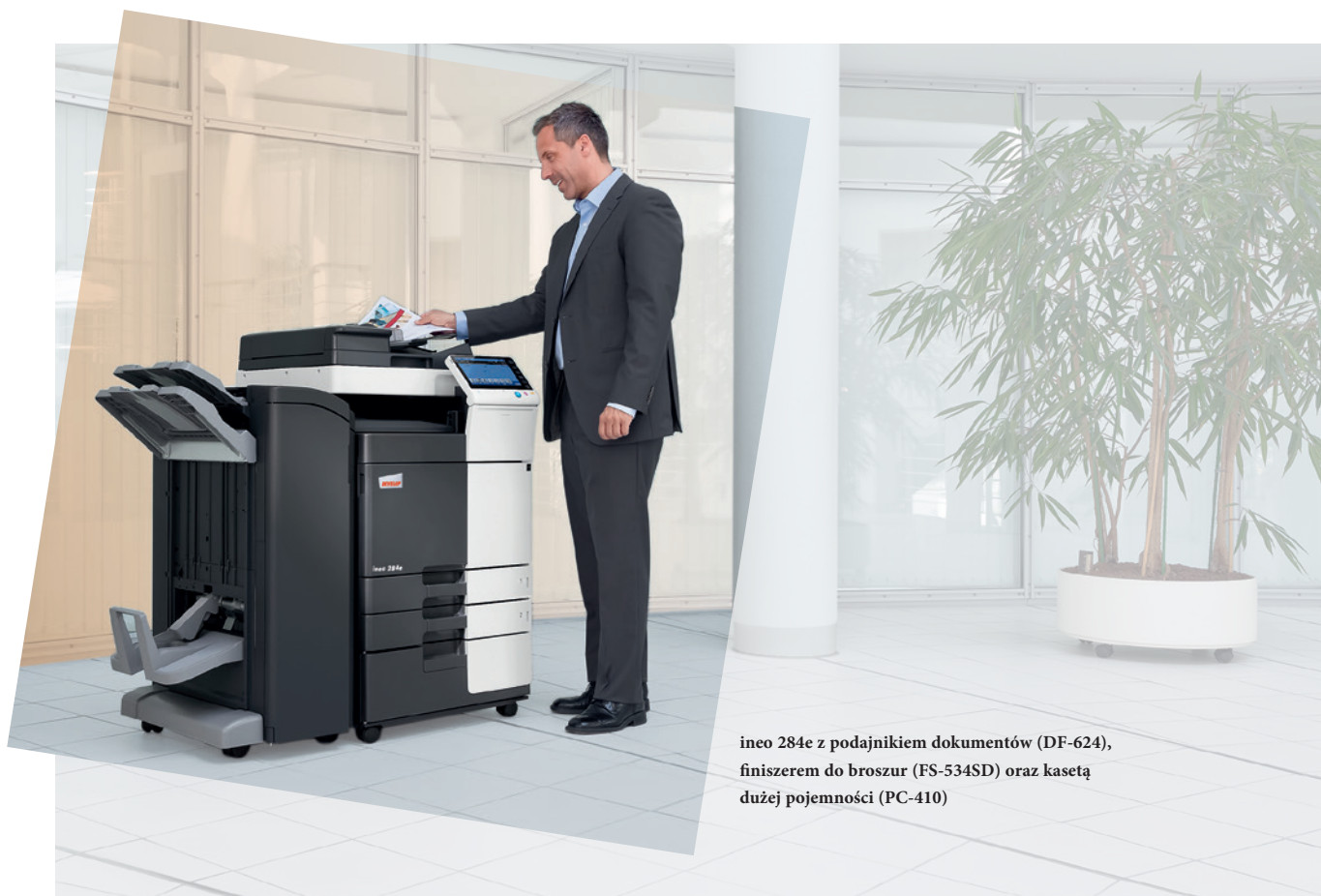
ineo 284e z podajnikiem dokumentów (DF-624), finiszerm do broszur (FS-534SD) oraz kasetą dużej pojemności (PC-410)

Te monochromatyczne systemy wyposażone są w liczne energooszczędne rozwiązania, które zmniejszają zużycie energii o ponad 40% w porównaniu do poprzednich modeli. Podczas gdy oszczędzają one pieniądze, inne ekologiczne rozwiązania są korzystne dla środowiska. Oznacza to, że oferowane przez DEVELOP urządzenia serii ineo e są nie tylko korzystne dla środowiska, ale również podkreślają troskę użytkownika o środowisko naturalne.