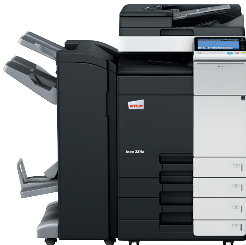
ineo 384e z dwustronnym podajnikiem oryginałów (DF-701), finiszerm zszywająco-broszurującym (FS-534SD) i podajnikiem papieru (PC-210)

Każde z tych wielofunkcyjnych urządzeń – ineo 224e, ineo 284e, ineo 364e, ineo 454e oraz ineo 554e – jest nie tylko wyjątkowo proste w obsłudze, lecz również oferuje szeroką gamę funkcji ułatwiających wykonywanie codziennych prac biurowych. Oszczędzając czas na drukowaniu, kopiowaniu lub skanowaniu, użytkownik może szybciej zająć się swoją właściwą pracą. A to znacznie podnosi wydajność.