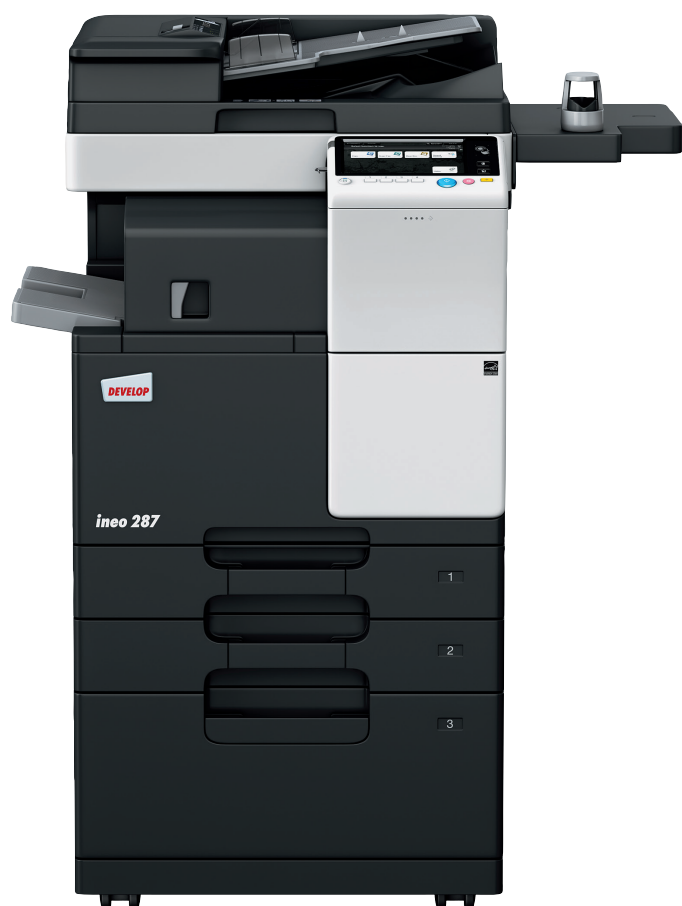
ineo 287 z podajnikiem dokumentów (DF-628), finiszerm wewnętrznym (FS-533), podajnikiem papieru (PC-413) modułem autoryzacji biometrycznej (AU-102)

Urzędy pracy, szkoły i uczelnie, firmy projektowe, architekci, firmy ubezpieczeniowe, banki, biblioteki - wiele małych i średnich firm tak naprawdę nie potrzebuje możliwości druku w kolorze. To, czego naprawdę potrzebują ci użytkownicy to monochromatyczne urządzenie wielofunkcyjne, które zapewnia intuicyjną prostotę obsługi i łatwą mobilną użyteczność ze względu na rosnącą liczbę pracowników biurowych.