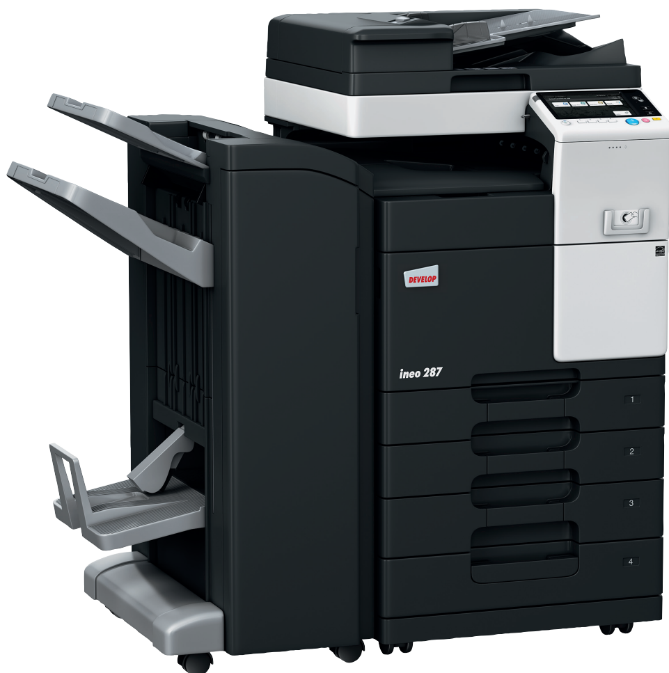
ineo 287 z podajnikiem dokumentów (DF-628), finiszerm do broszur (FS-534SD), podajnikiem papieru (PC-213) i modułem do montażu lokalnego urządzenia do uwierzytelniania kart identyfikacyjnych (MK-735)

Urządzenia monochromatyczne oferują szereg funkcji, które ograniczają zużycie energii. Oprócz oszczędności pieniędzy, funkcje te są również korzystne dla środowiska naturalnego i śladu węglowego.