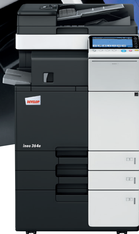
ineo 364e z podajnikiem dokumentów (DF-624) i kasetą dużej pojemności (PC-410)