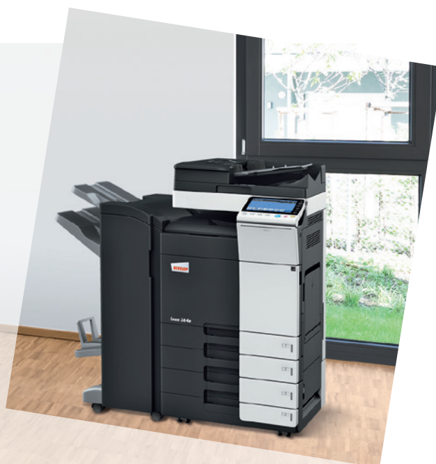
ineo 364e z podajnikiem oryginałów (DF-701), finiszerm do broszur (FS-534SD) i podajnikiem papieru (PC-210)