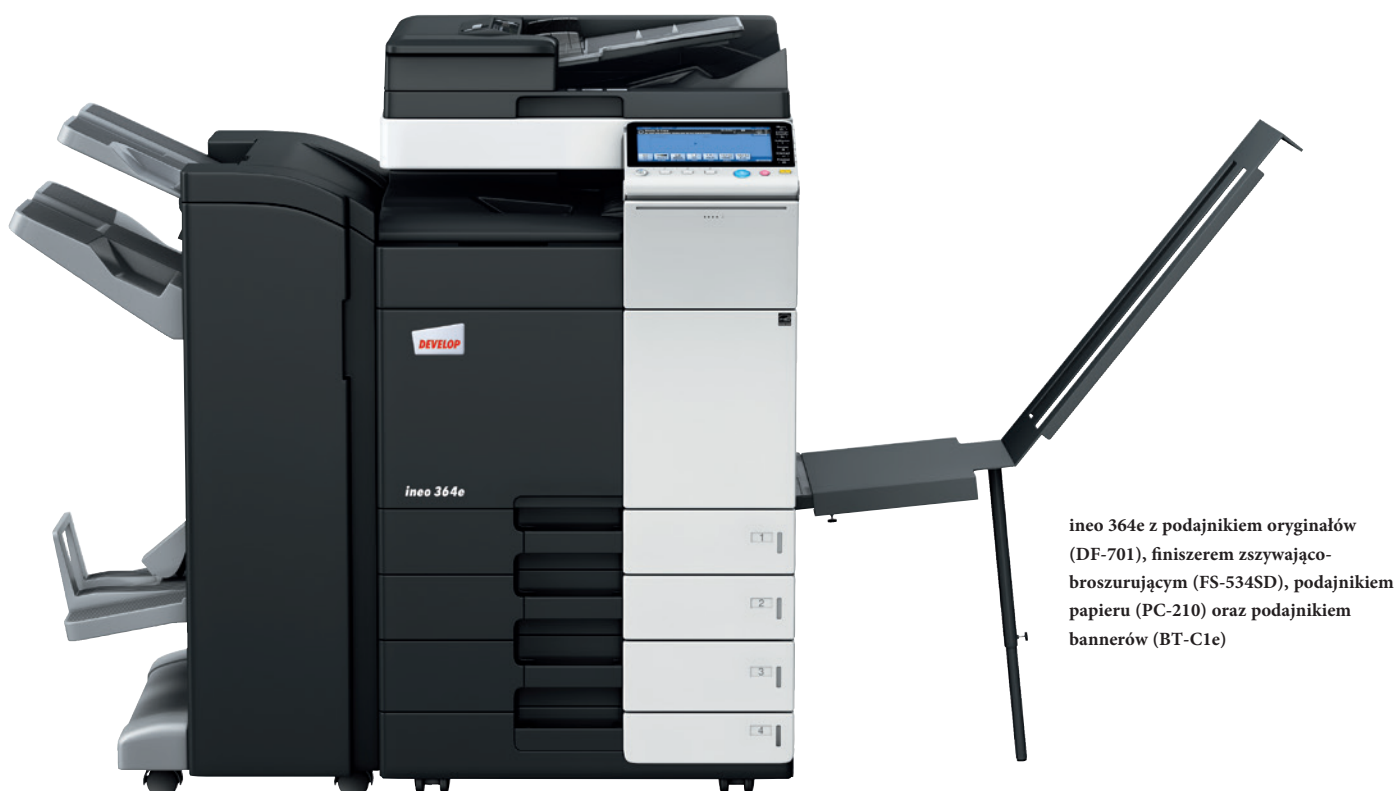
ineo 364e z podajnikiem oryginałów (DF-701), finiszerm zszywająco-broszurującym (FS-534SD), podajnikiem papieru (PC-210) oraz podajnikiem bannerów (BT-C1e)

Każde z tych wielofunkcyjnych urządzeń – ineo 224e, ineo 284e, ineo 364e, ineo 454e oraz ineo 554e – jest nie tylko wyjątkowo proste w obsłudze, lecz również oferuje szeroką gamę funkcji ułatwiających wykonywanie codziennych prac biurowych. Oszczędzając czas na drukowaniu, kopiowaniu lub skanowaniu, użytkownik może szybciej zająć się swoją właściwą pracą. A to znacznie podnosi wydajność.