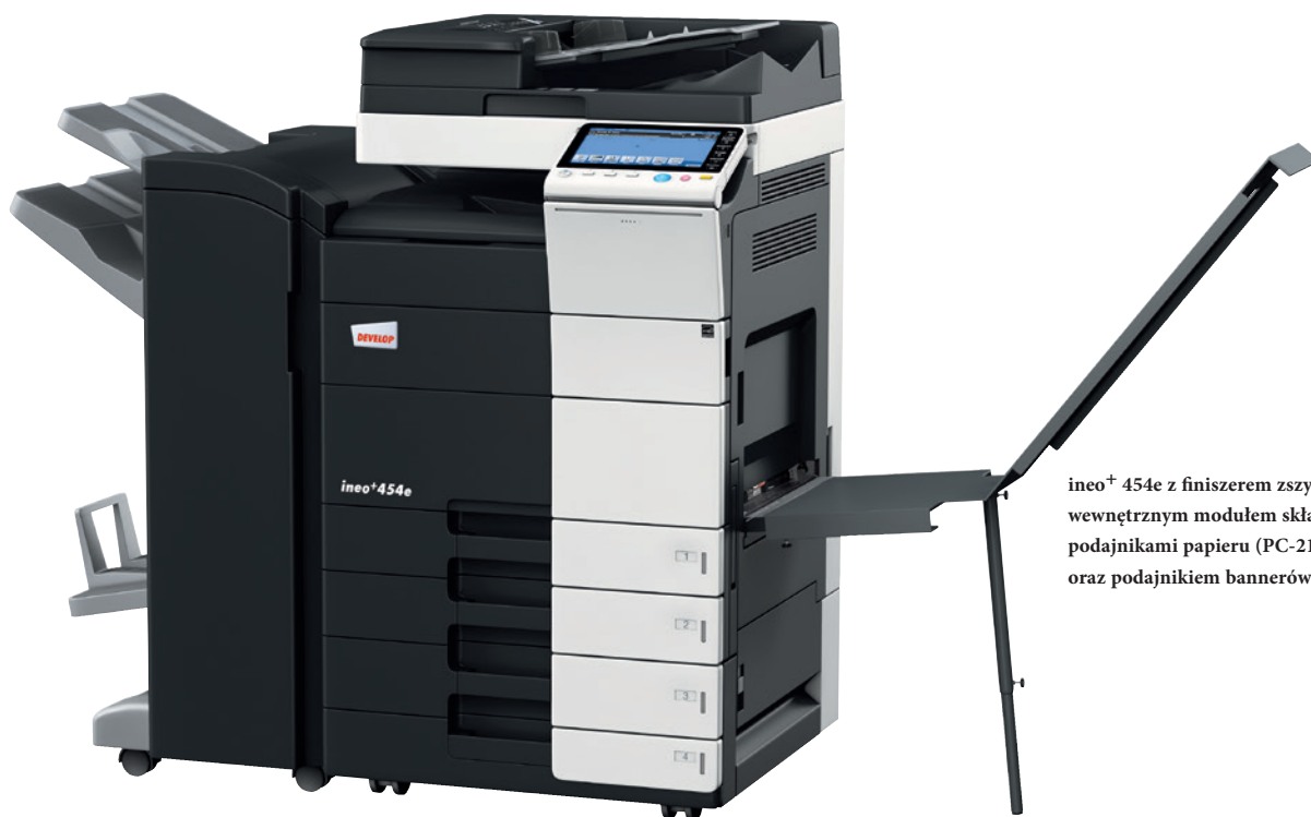
ineo+ 454e z finiszerm zszywającym (FS-534), wewnętrznym modulem składającym (SD-511), podajnikami papieru (PC-210), oraz podajnikiem bannerów (BT-C1e)