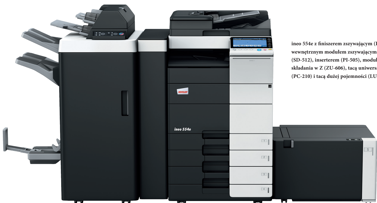
ineo 554e z finiszerm zszywającym (FS-535), wewnętrznym modulem zszywającym (SD-512), inserterem (PI-505), modulem składania w Z (ZU-606), tacą uniwersalną (PC-210) i tacą dużej pojemności (LU-204)

Każde z tych wielofunkcyjnych urządzeń – ineo 224e, ineo 284e, ineo 364e, ineo 454e oraz ineo 554e – jest nie tylko wyjątkowo proste w obsłudze, lecz również oferuje szeroką gamę funkcji ułatwiających wykonywanie codziennych prac biurowych. Oszczędzając czas na drukowaniu, kopiowaniu lub skanowaniu, użytkownik może szybciej zająć się swoją właściwą pracą. A to znacznie podnosi wydajność.