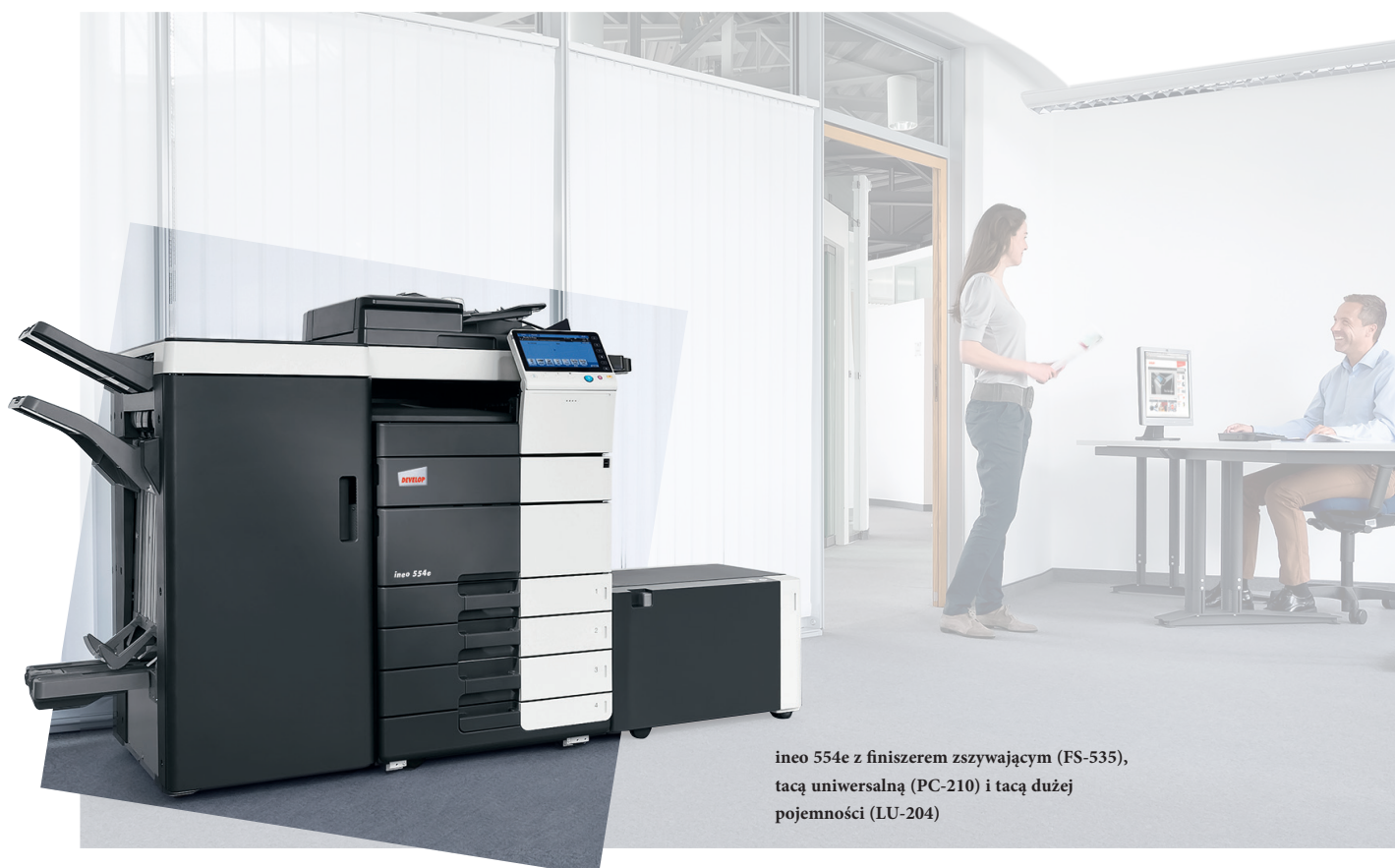
ineo 554e z finiszerm zszywającym (FS-535), tacą uniwersalną (PC-210) i tacą dużej pojemności (LU-204)

Te monochromatyczne systemy wyposażone są w liczne energooszczędne rozwiązania, które zmniejszają zużycie energii o ponad 40% w porównaniu do poprzednich modeli. Podczas gdy oszczędzają one pieniądze, inne ekologiczne rozwiązania są korzystne dla środowiska. Oznacza to, że oferowane przez DEVELOP urządzenia serii ineo e są nie tylko korzystne dla środowiska, ale również podkreślają troskę użytkownika o środowisko naturalne.