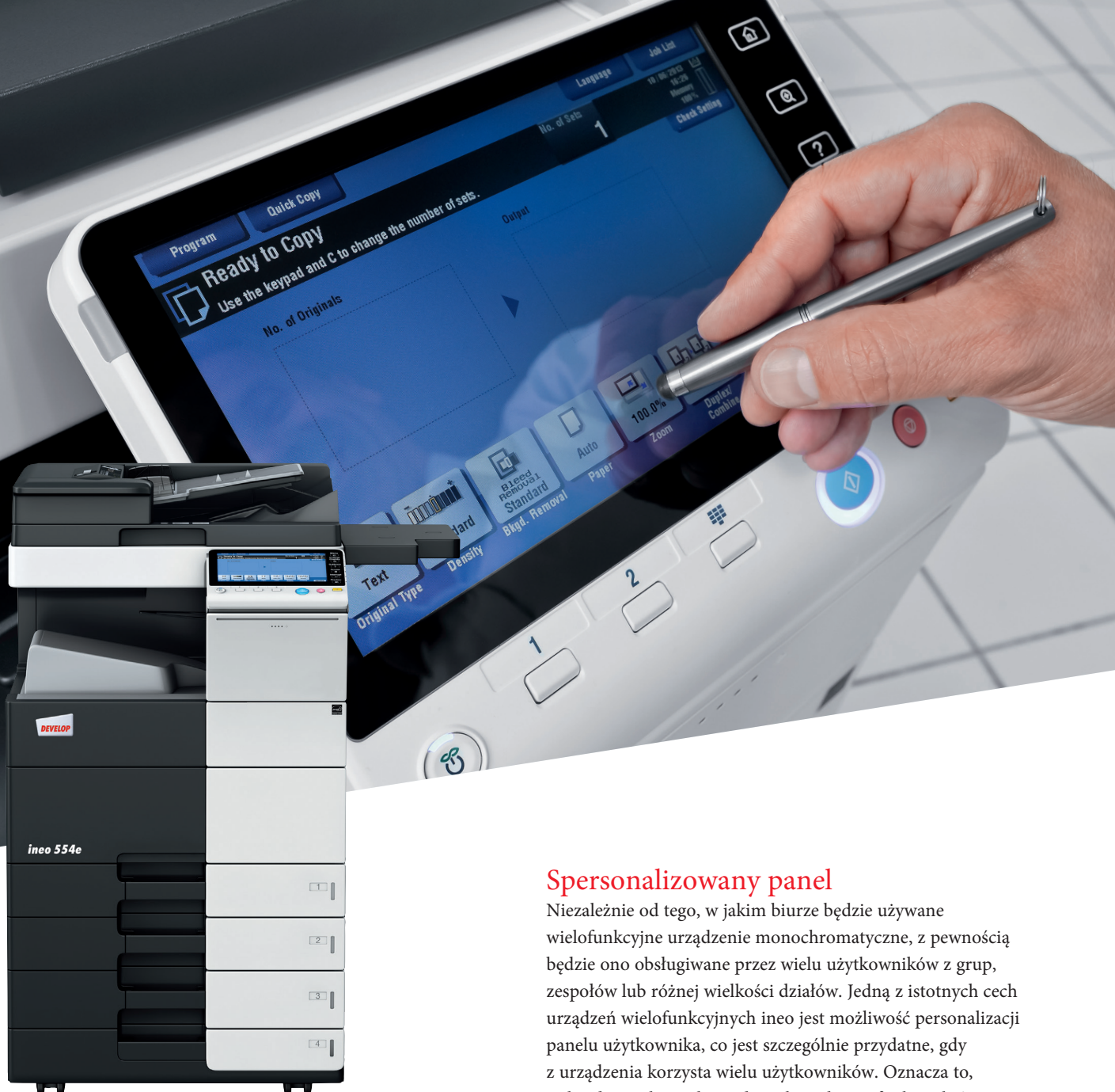
ineo 554e z tacą uniwersalną (PC-210), półką boczną (WT-506) i tacą odbiorczą (OT-506)